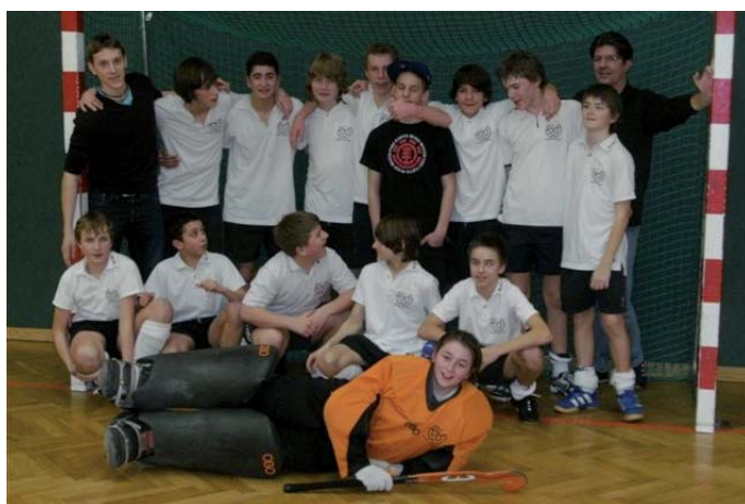
U14männlich Meister: HC Wien

HC Wien sichert sich mit zwei doch überlegenen Siegen den wohlverdienten Meistertitel in der U14m.