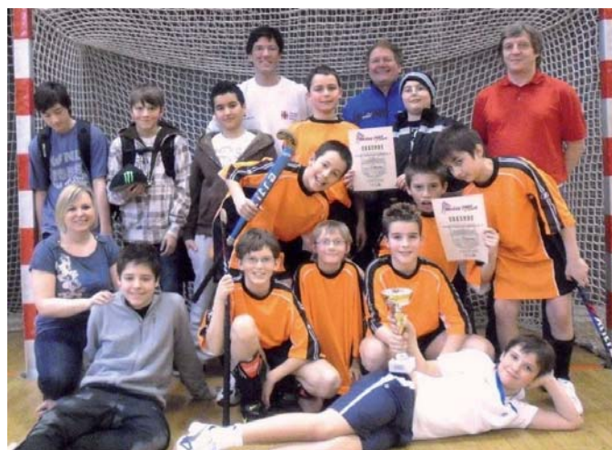
Jakob Thoma Schule

Höhepunkt das Bubenfinale: Die Jakob Thoma Mittelschule geht früh in Führung und als knapp vor Spielende der EMS Mödling „endlich“ der Ausgleich gelingt, können die Jungs der Jakob Thoma Schule sofort wieder zurückschlagen und verteidigen dann den knappen 2-1 Vorsprung bis zum Schluß.