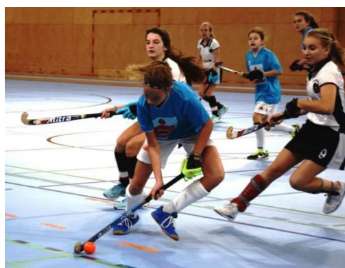
Bundesfinale in Österreich 2018