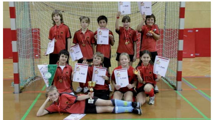
U10 Sieger WAC

Da im U-10 Bewerb der WAC, verstärkt mit Spielern des AHTC, nur 3 Gegentreffer zugelassen hat, konnten unsere Spieler den Siegerpokal ungeschlagen in die Höhe stemmen. Den 2. Platz sicherte sich, aufgrund des besseren Torverhältnis Zelina knapp vor Epiök. Der vierte Platz erging an die Minis der Grasshoppers.