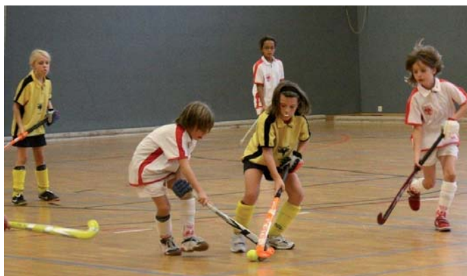
U10: Neudorf vs Post WEISS