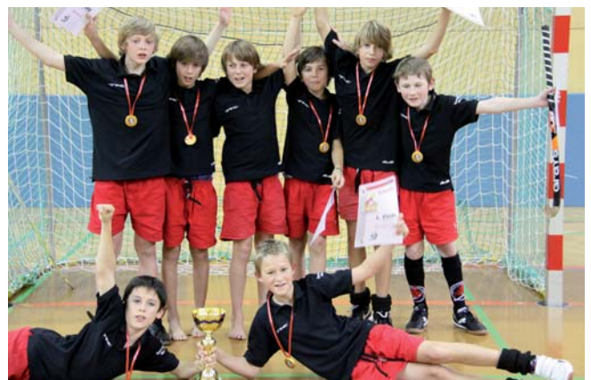
U12 Sieger Grasshoppers

Das U-12 Turnier bestritten 7 Mannschaften. Hier gab es spannende Spiele, vor allem um die Pokale für die drei besten Mannschaften. Schlussendlich konnte sich Grasshoppers 1 gegen Greuther-Fürth und Rosenheim knapp durchsetzen. Die Freude über den Sieg, den Pokal, die Urkunden und die (inzwischen traditionellen) Mozarttaler-Medaillen war riesig. Unsere Mannschaft, etwas ersatzgeschwächt, hat den sechsten Platz belegt.